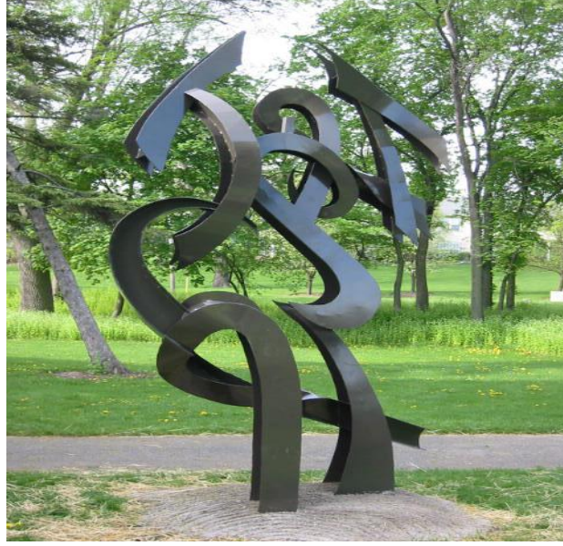
شكل (٥) نحت حروفي بالفراغ (١)