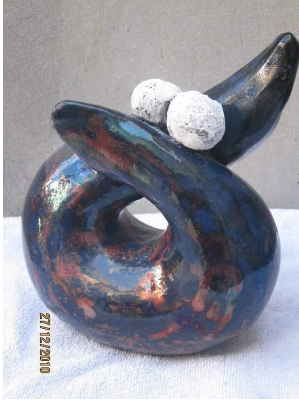
شكل (١١) الخزافة ميسون على ،ليبيا، ٢٠×٣٠سم، إنتاج ٢٠١٠، تاء مربوطة