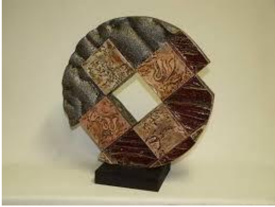
شكل (١٣) الفنان وسام حداد - بينالي أندنه لفن الخزف بلجيكا - ٢٠١٢