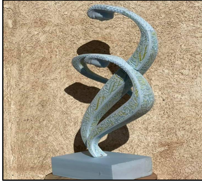
شكل (١٧) حرف الراء - الأبعاد ٥٠*٧٠*١٠سم - polyurethane البولي يوريثان أو الفوم - ٢٠٢٠