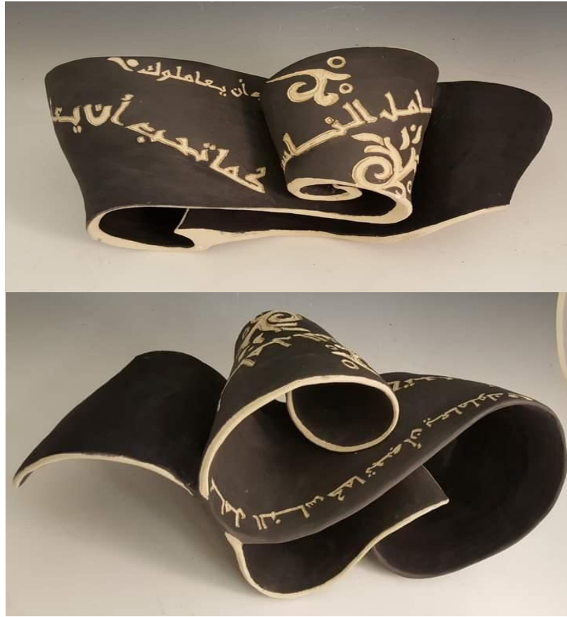
شكل (١٠) الخزافة هدي هاوسوي، ٤٦ × ٥٦ سم إنتاج ٢٠١٥