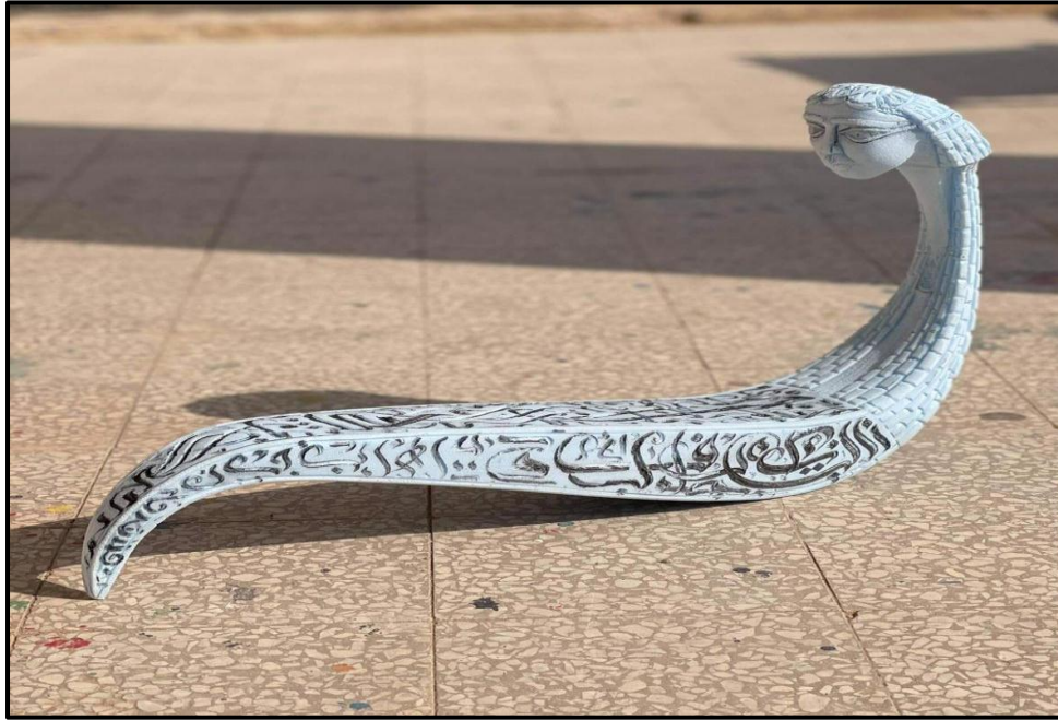
شكل (١٦) حرف الراء - الابعاد ٥٠*٧٠*١٠سم - polyurethane البولي