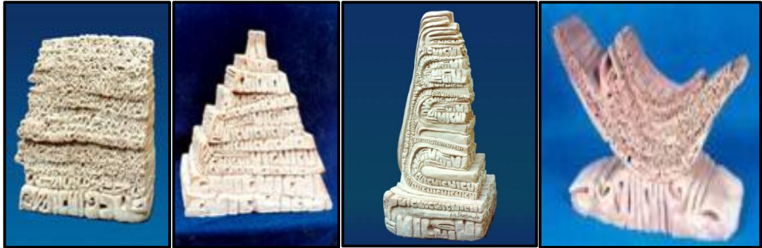
شكل (٢) بعض أشكال الحروفية