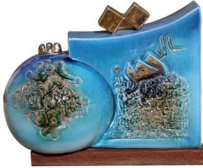
شكل (٧) الفنان الخزاف /رضا الدليمي مقتنيات متحف جلعاد