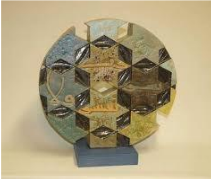
شكل (١٤) الفنان وسام حداد - بينالي أندنه لفن الخزف بلجيكا - ٢٠١٢