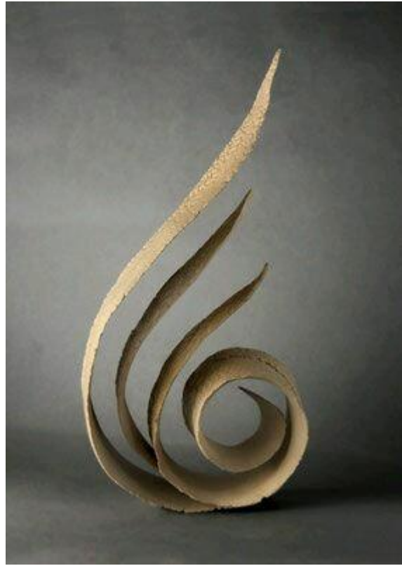
شكل (١٢) فيليري ، إبداعات د ، صالات بيتور ، منحوتات ، الجلوس بيرفي ، النحات