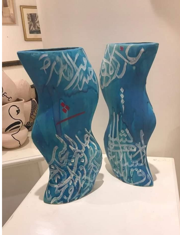
شكل (٦) الفنانة عواطف أحمد القنبيط / المملكة العربية السعودية، مقاييس العمل