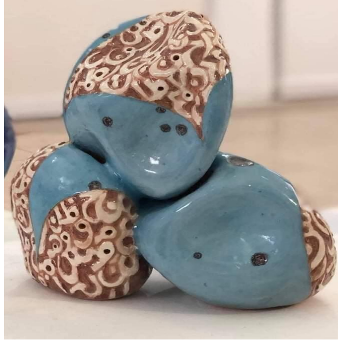
شكل (٩) الخراف سعد العاني العراق، ٢٠١٨